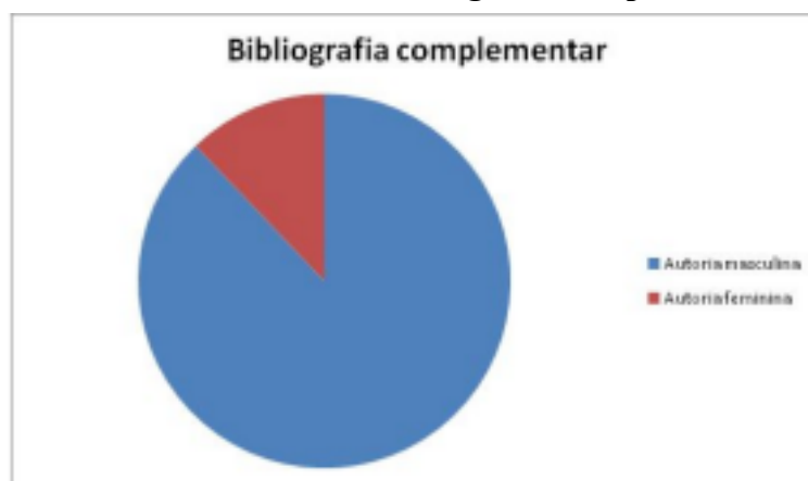
Gráfico 2 - Análise de bibliografia complementar