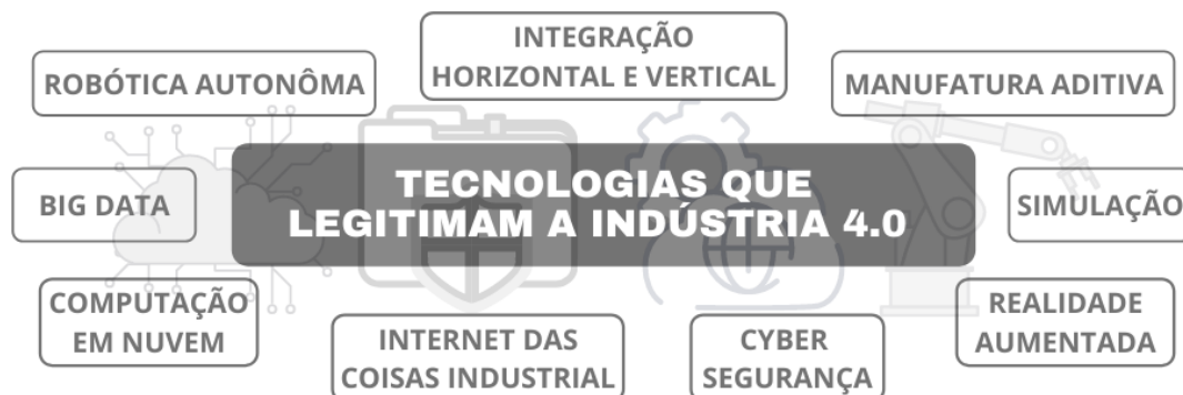
Figura 2 – Tecnologias que embasam o processo de implementação da indústria 4.0

Esse modelo de indústria. foi inicialmente proposta em 2011, na Alemanha, com o intuito de desenvolver a economia alemã, país onde a Quarta Revolução Industrial tem suas raízes e bons desfechos na economia. Definida por Boyes et al. (2018) como um coletivo de tecnologias e conceitos de organização da cadeia de valor, em que há uma comunicação e cooperação entre os humanos e os sistemas ciberfísicos. “Que tornará possível reunir e analisar dados entre máquinas, permitindo processos mais rápidos, flexíveis e eficientes, produzindo bens de maior qualidade e com custos reduzidos” (RÜßMANN et al. 2015).