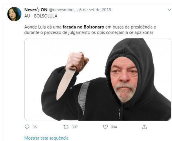
Imagem 04: Tweet produzido no episódio da facada atribuindo a autoria do atentado ao ex-presidente Lula.

Esse meme ainda teve algumas versões onde circulou somente a imagem e em outros casos, usou o rosto da cantora Pabllo Vittar. A imagem vem para ilustrar a história apresentada. “AU” quer dizer Alternative Universe, em português, Universo Alternativo.