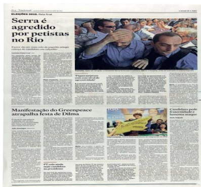
Imagem 05: Manchete exibindo em destaque uma imagem de Serra sendo conduzido por sua equipe com a mão na cabeça. em texto, lê-se “Serra é agredido por petistas no Rio”.

Imagem 05 - Manchete de jornal noticiando em destaque o “ataque” sofrido por José Serra