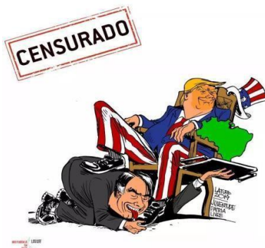
Imagem 06: Meme em que Bolsonaro lambe os pés do Trump

Imagem 06 - Meme retratando a submissão do governo brasileiro aos Estados Unidos