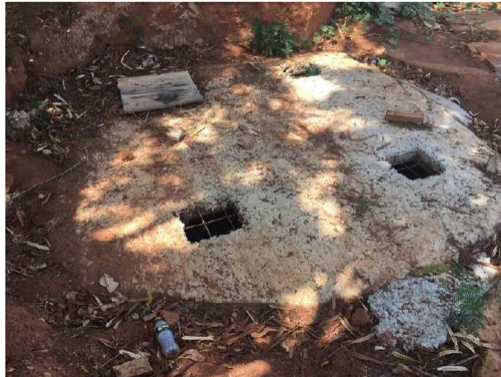
Figura 2: ETE parcialmente descoberta.